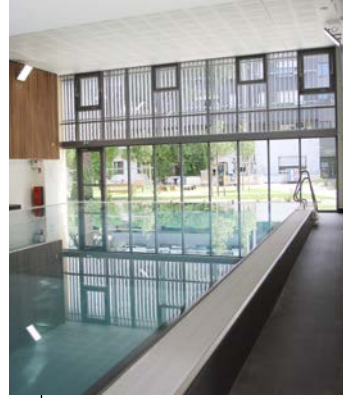
Espace de balnéothérapie et gymnase